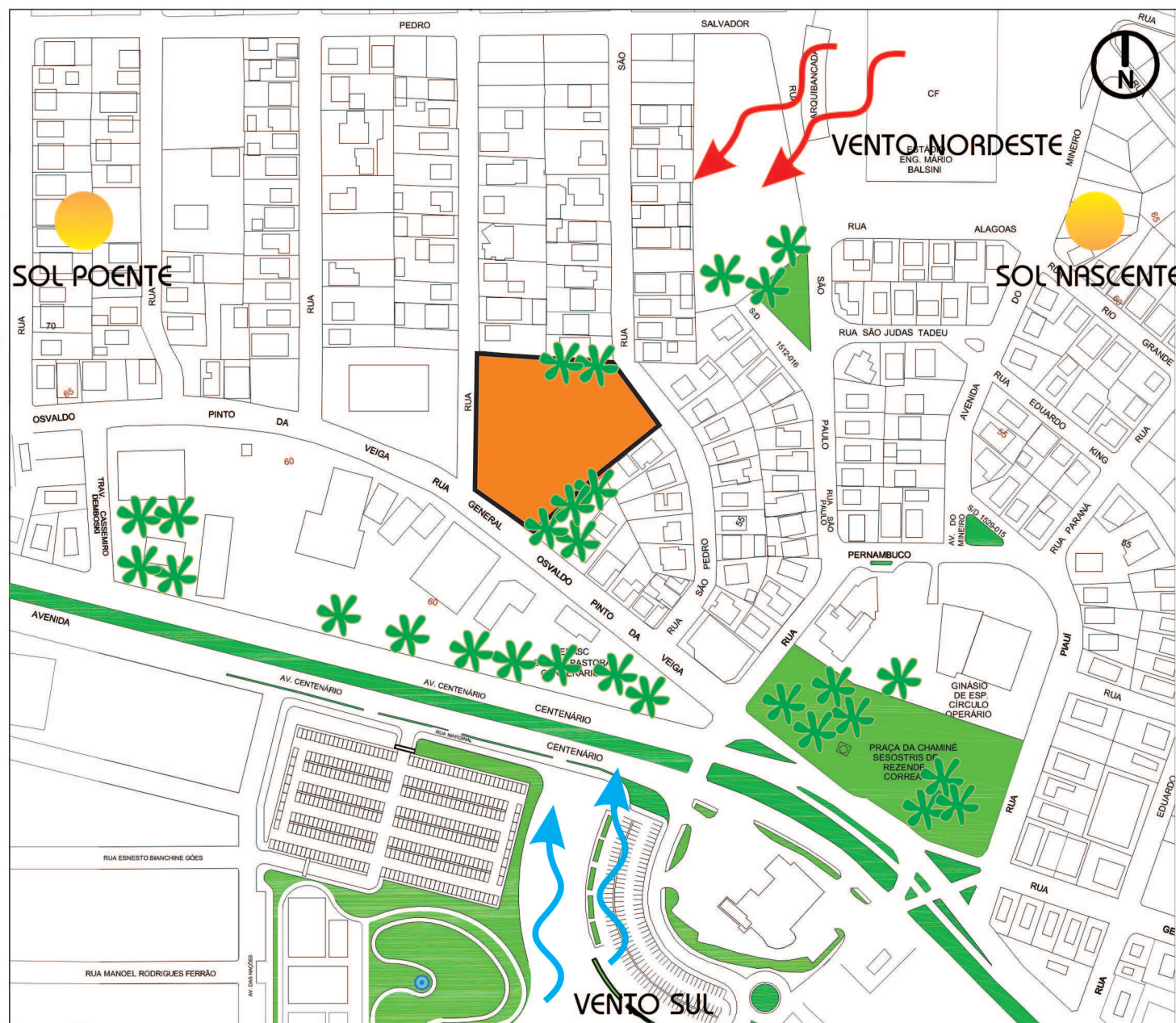
Mapa 019 Escala: 1/3300