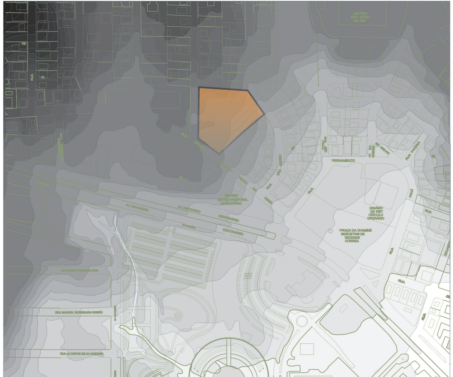
Mapa 020 Escala: 1/3300

O entorno possui uma topografia mais acentuada, e o terreno fica na parte mais baixa, por isso são necessários cuidados com escoamento da água da chuva, deixando áreas permeáveis no local,