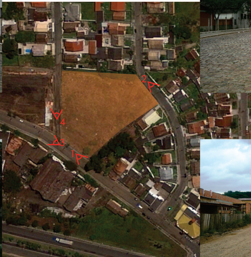
Figura 072 até 076